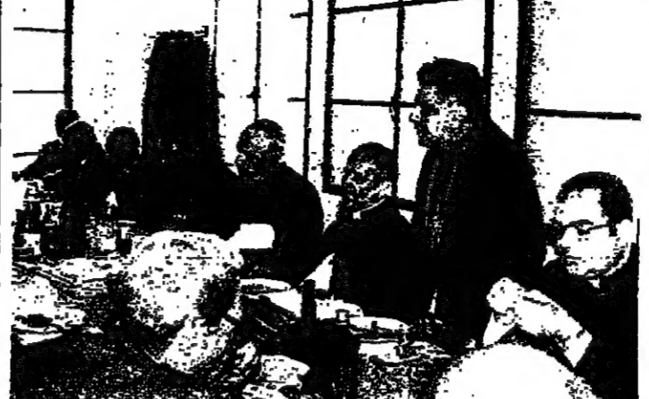
الابائي شربل تميم يلقى كلمته في ملبة التكريم

وهو هو مطرانكم منكم وبنينكم وبنينكم منكم، وهو مرجعكم، فالطائفة المارونية هي لبنان، ولما ابدع من لبنان، وانتم يا ابناء بعلبك وزحلة والجزيرة التي ابرشتها لكم لتعلم من اجل نفسكم، كما شارك في لبنان والامس واليوم وقد ادى الابدع وهذا الاحتفال تكريس لذلك.